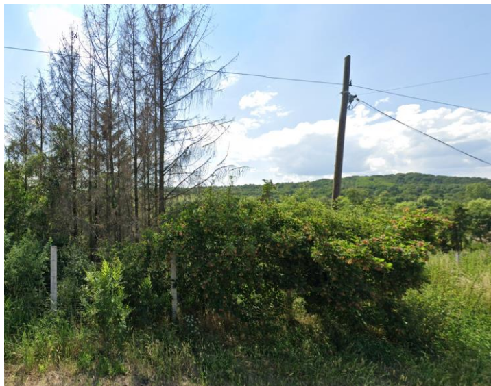
1. kép: a település határában