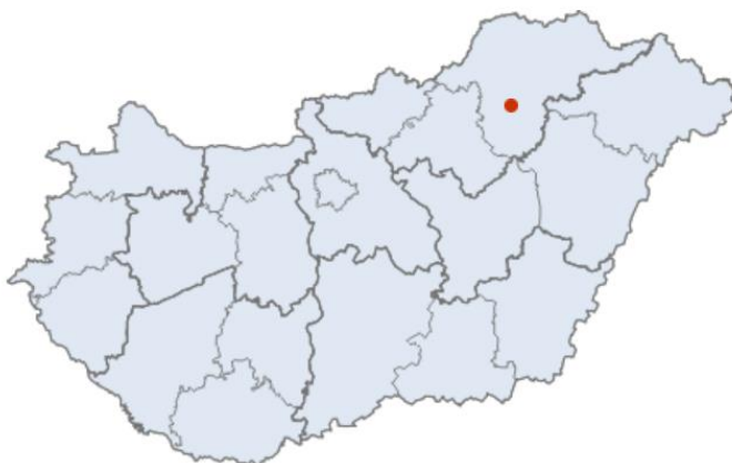
1.térkép: Bükkaranyos Község elhelyezkedése 1

Csak közúton érhető el, Emőd felől a 2514-es úton – ez a község főutcája –, valamint Miskolc Görömböly városrésze és Vatta felől, mindkét irányból a 2515-ös úton, mely a település északi külterületeit szeli át.